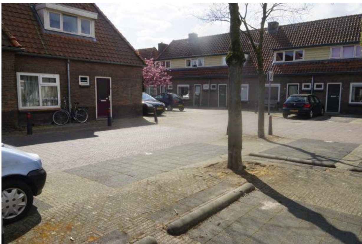
Verstening versus groen in de stad

oplossingen zijn noodzakelijk om voor al die opgaven in samenhang meerwaarde te realiseren. Kortom groen, natuur en landschap vormen een belangrijke opgave voor de Omgevingsvisie. Hoofdlijnen kunnen –via interactie op inhoud en proces– met het programma Groen en de regionale Landschapsvisie worden overgenomen in Omgevingsvisie.