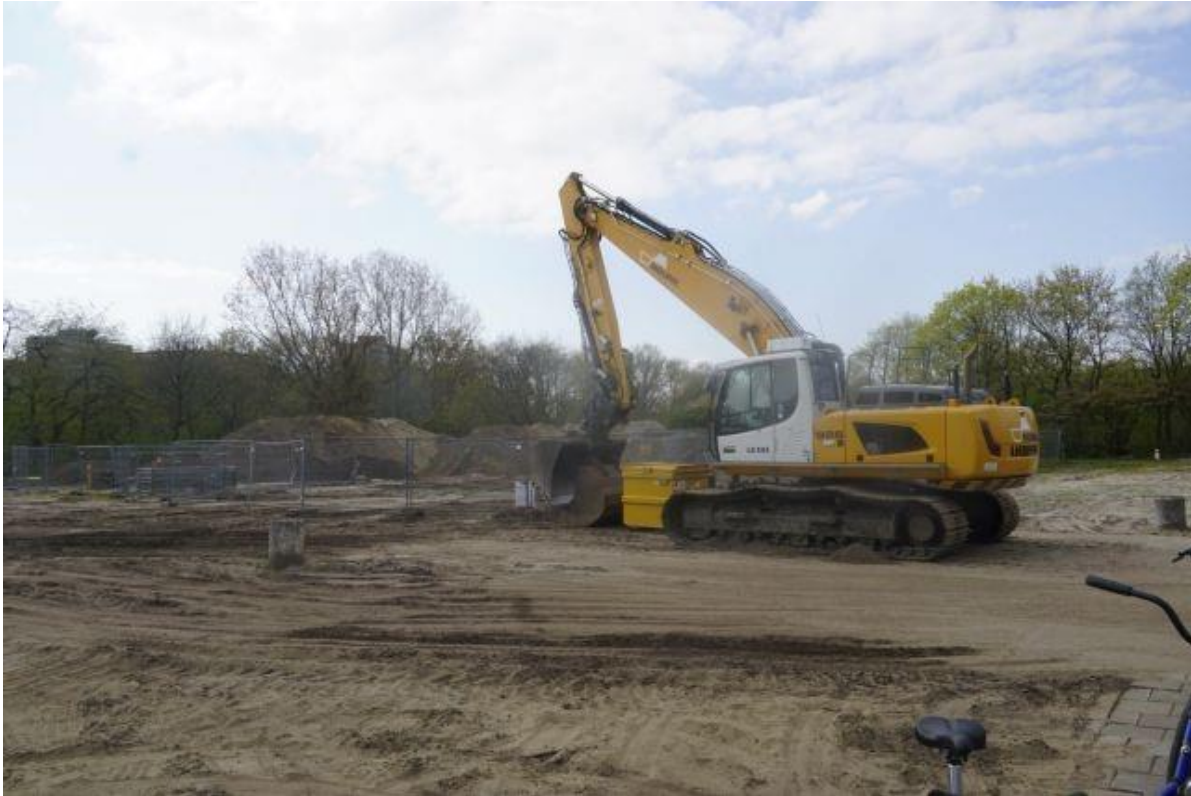
Circusterrein in 2040, wonen, werken, groene/blauwe oase of...

parkeren vormen daarmee belangrijke thema's voor de gemeentelijke Omgevingsvisie. De interactie op proces en inhoud met de Mobiliteitsvisie kan zorgen voor een goede integrale afweging van de oplossingsrichtingen. De doelen op hoofdlijnen bepalen we in de Omgevingsvisie. De Mobiliteitsvisie uitwerken als programma in de zin van de Omgevingswet geeft vorm aan hoe we de doelen kunnen realiseren.