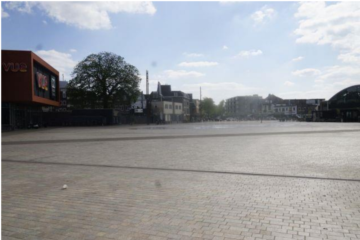
Recent heringericht marktplein

De recente herinrichting van het Marktplaats is een interessant voorbeeld van versterking van de levendigheid van het centrum rekening houdend met vele andere belangen, zoals parkeren, doorstroming en wonen. Een andere interessante casus is het Circusterrein. Wat is vanuit de volledige reikwijdte van de fysieke leefomgeving de huidige en potentiële waarde van het marktplein?