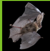
Gewone grootoor- vleermuis