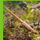
Kleine water- salamander