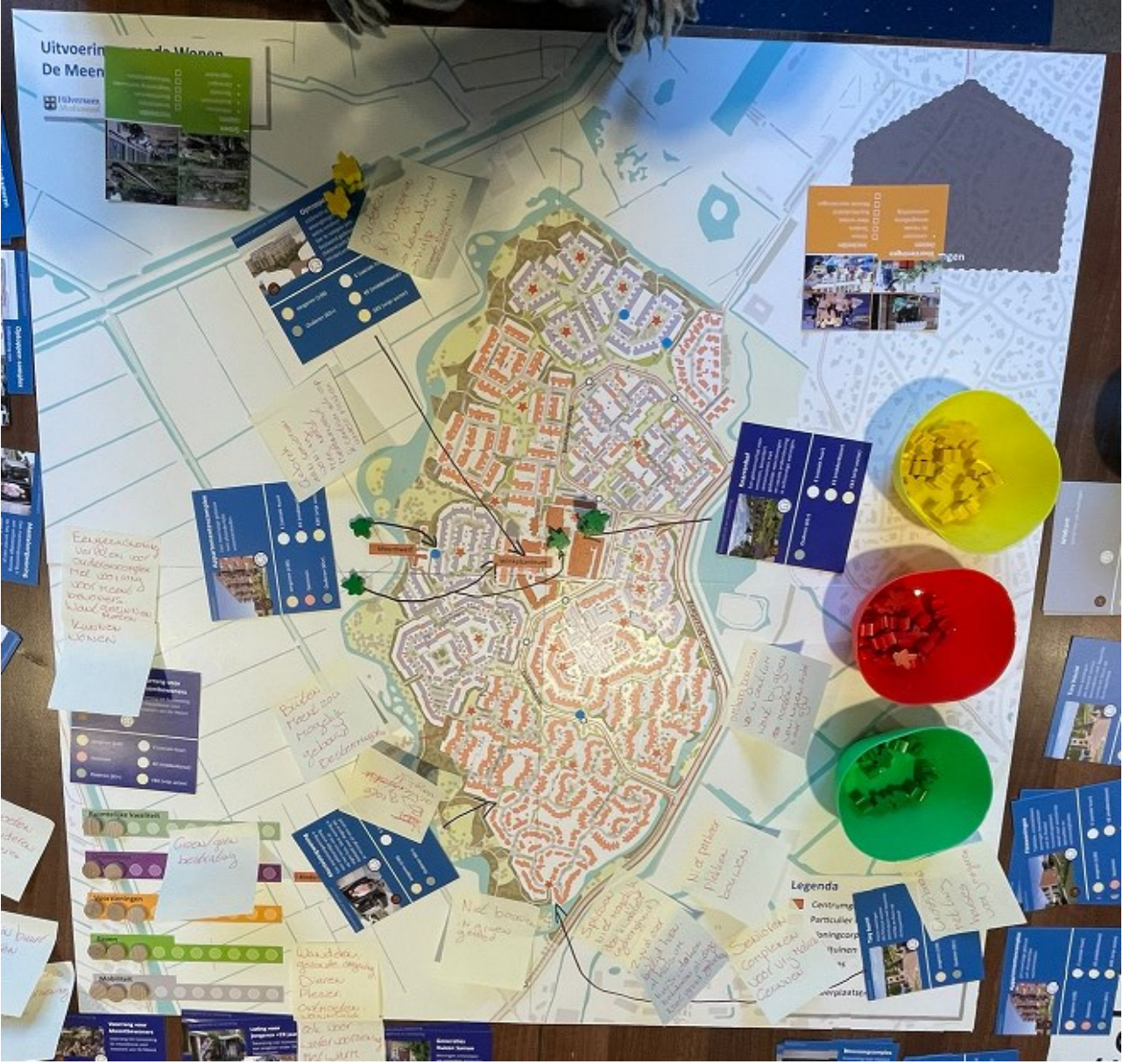
Kaart tafelgesprek 2