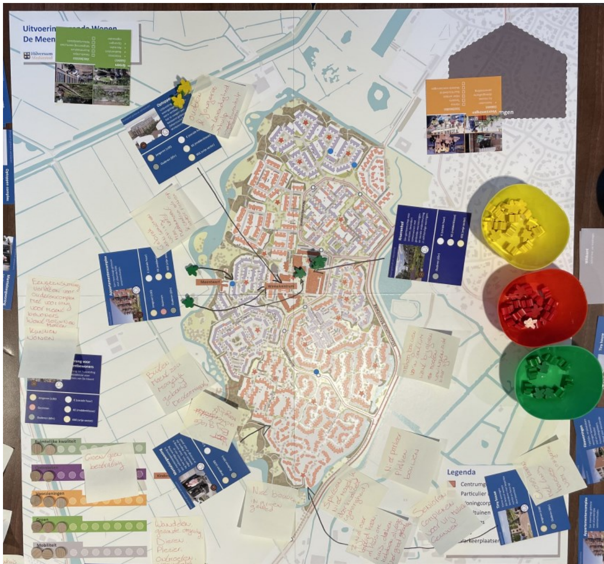
Kaart tafelgesprek 1