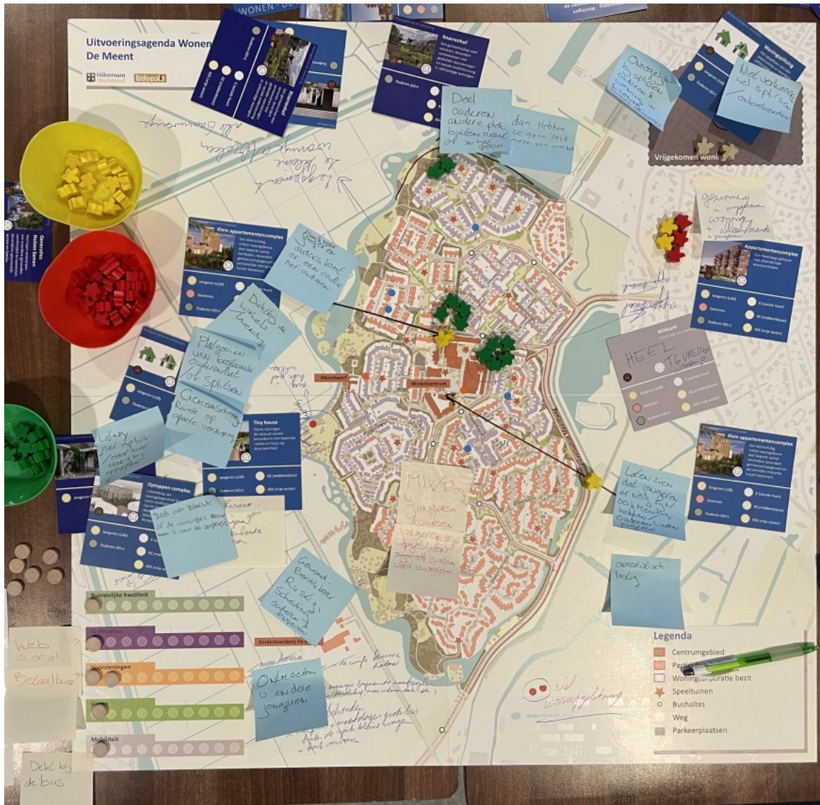
Kaart tafelgesprek 5