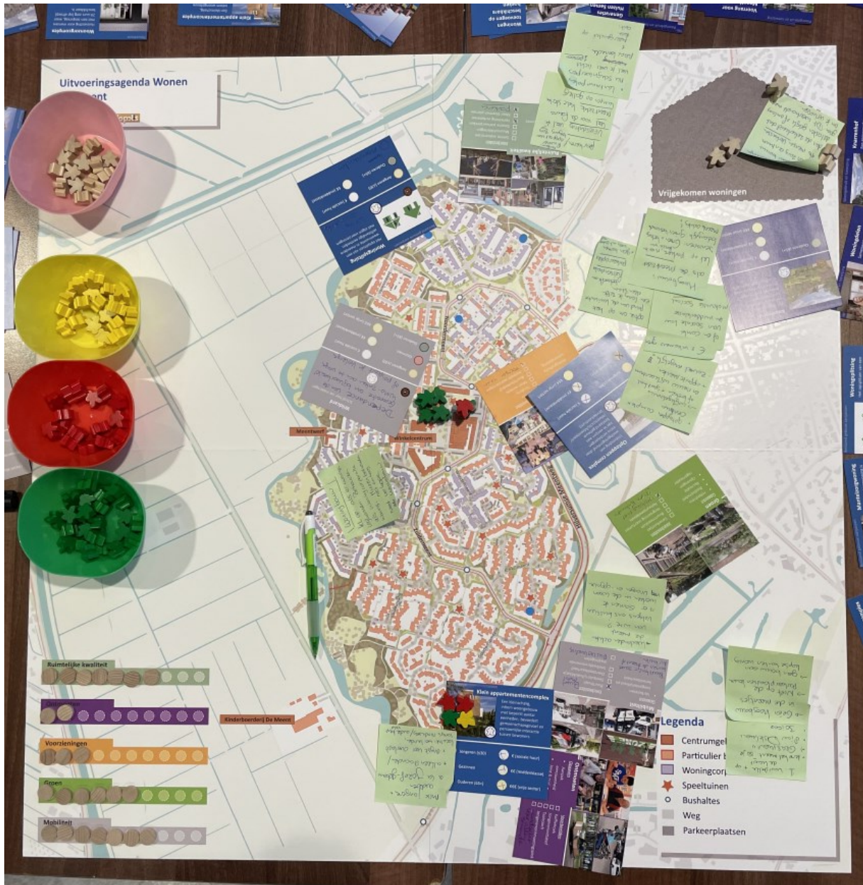
Kaart tafelgesprek 4