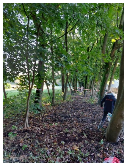
10.000 Stinzenbollen geplant bij het Heksenweitje door Buurtvereniging Trompenberg-Oost, samen met scholieren van de Godelindeschool.