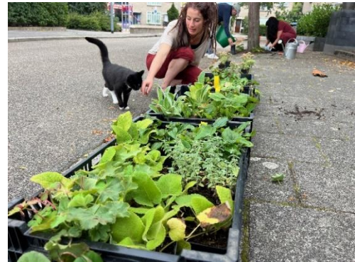
Boomspiegelfeest Kerkelanden, 2 hofjes aangepakt, 65 boomspiegels geadopteerd door de buurt en samen beplant.