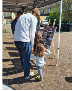
Participatiebijeenkomst speelplekken Goudwespmeent en Klavermeent: er wordt gestickerd en getekend door aanwezige bewoners en kinderen

Hieronder staat een overzicht van de projecten uit het Uitvoeringsprogramma Programma Groen 2023 – 2026.